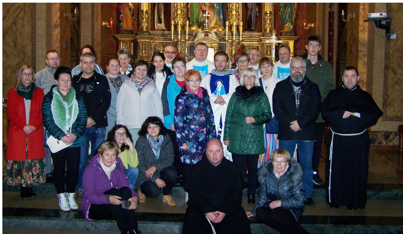
Uczestnicy spotkania w Dąbrowie Górniczej

Kolejne spotkanie animatorów misyjnych odbyło się 5.XI.2022 r. w franciszkańskiej parafii św. Antoniego z Padwy w Dąbrowie Górniczej Gołonogu. Przybyli na nie animatorzy z Jasta, Sanoka, Horyńca, Kalwarii Paclawskiej, Radomska, Dąbrowy Górniczej, Harmęż, Głogówka, Zielonej Góry, Lwówka Śląskiego, Wrocławia.